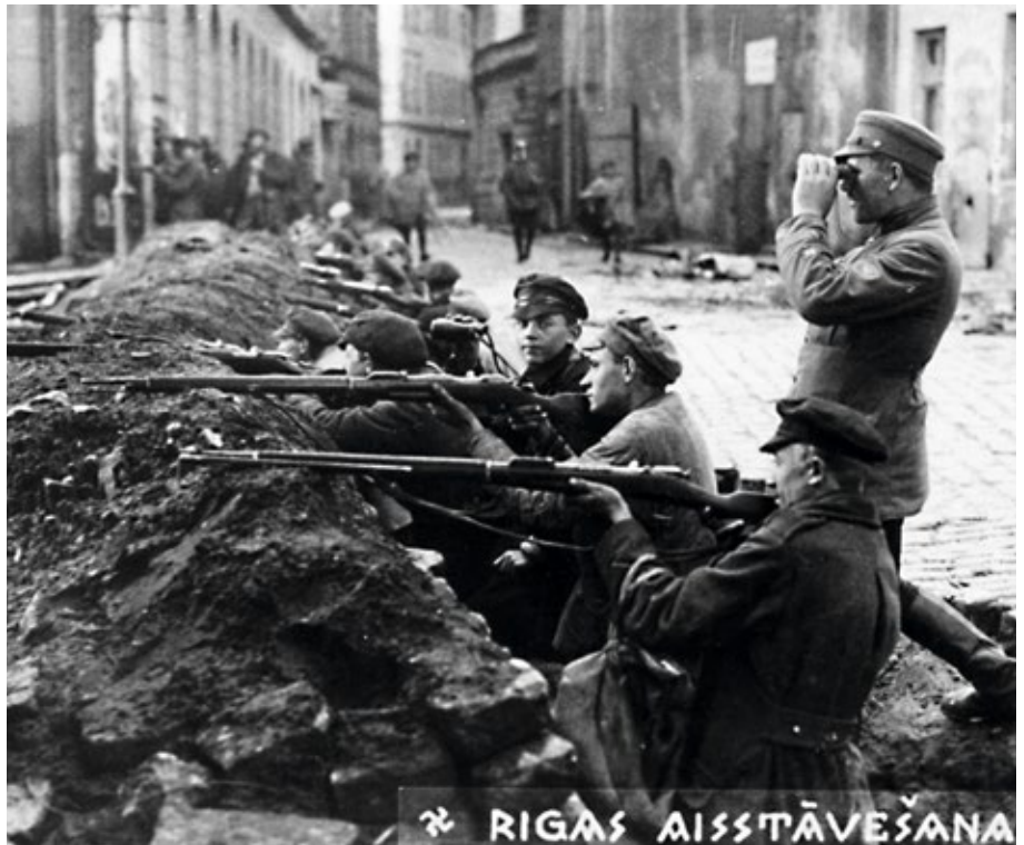
Latvijas armijas karavīri Vecrīgā Bermonta armijas uzbrukuma laikā 1919. gada novembrī

Protams, mitoloģizēts – kaut vai tādās filmās kā "Rīgas sargi", kas man pašam nepatīk. Bermonts ir pataisīts par idiņu . Pilnīgu idiņu . Bet kāpēc mēs visvairāk karavīru zaudējam pret viņu, ja reiz viņš ir tāds idiņš ? Tā domāt ir muļķīgi un pašpazemojoši. Bermontam bija sava ideja un diezgan skaidrs plāns: viņš gribēja likvidēt "nelikumīgos valstiskos veidojumus" savā aizmugurē un padarīt to drošu, lai savienotos ar Judeļņiču no ziemeļiem un dotos tālāk. Nežēlīgas metodes ir abpusējas, bet arī glēvulība pastāv abās pusēs, piemēram, latviešu masveida bēgšana 9.–10. oktobrī, neklausīšana virsniekiem, panika. Protams, pateicoties varonībai, izdodas to pārvarēt. Ir arī daudz neskaidrību. Pastāv mīts par to, ka Bermonts šajās oktobra dienās īsti necentās forsēt Daugavu, lai gan nebūtu neviena, kas viņam pretotos. Tur bija citi apstākļi – komandieri un ierindas karavīri izrādījās vājāki, Rietumu sabiedroto faktors. Arī nežēlība bija liela abās pusēs, piemēram, karagūstekņu šaušana. Karš ir karš, un neviens nav tīrais bruņinieks baltās drēbītēs. Arī latvieši ne – vecais naidis tajā brīdī izpaužas pilnībā.