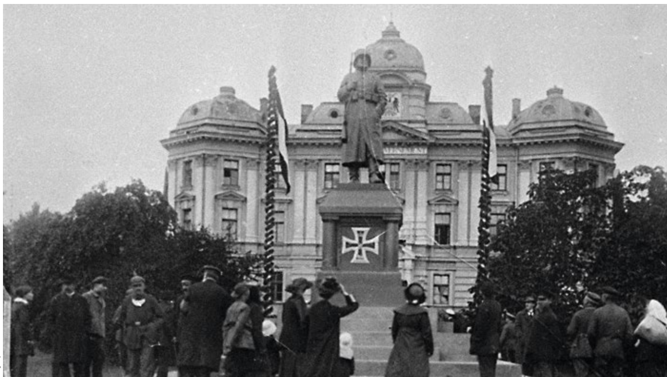
Vācu okupācijas varas simbola – pieminekļa "Dzelzs zemessargs" (tautā saukts par "Koka Frici") atklāšana Rīgā 1918. gada 3. septembrī

satelītvalsti, kas būs boļševiku Krievijas sabiedrotā. Tā, no vienas puses, boļševiki rāda, ka ievēro nacionālās intereses. No otras puses, viņi grib, lai ļoti lojālie vietējie komunisti izveido tiltu uz revolucionāro Vāciju. Padomju Latvija ir pagaidu veidojums, tai ir kopīga armija ar boļševikiem, bet Ļeņins ļauj, lai Stučka pamēģina. Un, līdzīgi kā Ungārijā un Igaunijā, lielnieki pieļauj divas galvenās kļūdas: terorismu un savu agrāro reformu. Zemniekam ir nepieciešama zeme, viņš par to sapņo, un tāpēc arī viņus atbalsta. Tiklīdz boļševiki ievieš sava veida dzimtbūšanu , sāk dibināt savas komūnas (mums labāk pazīstamā kolhoza paveids), viņu plāni izgāžas. Viņi paši pēc tam atzina šo kļūdu.