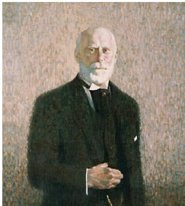
Prezidenta Jāņa Čakstes portrets (fragments) 1995, a., e., 157 x 92