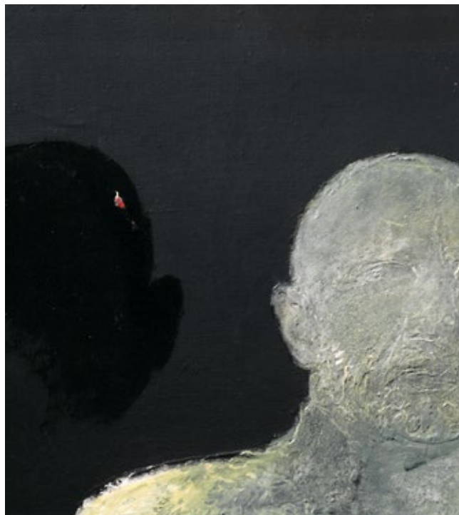
Pašportrets. Centrālā daļa no triptiha Vivat, color! 2001, a., e., 30 x 30

Varonība? Jā, devalvēts vārds, bet kā lai citādi raksturo tā cilvēka dzīvi, kurš pašmācības ceļā pašaieliedzīgi, neraugoties