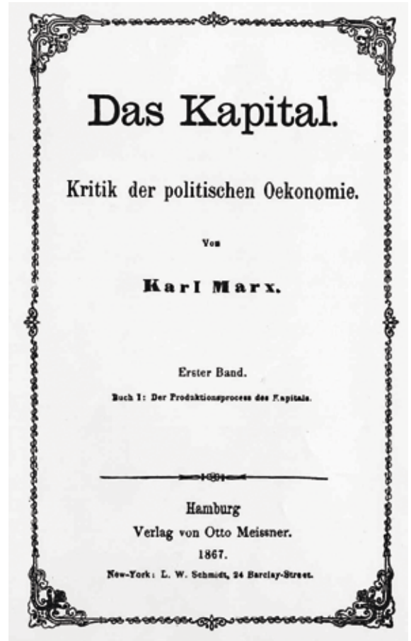
UNESCO programmas “Pasaules atmiņa” starptautiskajā reģistrā ir iekļauta K. Marksa un F. Engelsa “Komunistiskās partijas manifesta” manuskripta lappuse un K. Marksa “Kapitāla” pirmizdevums ar autora piezīmēm lappušu malās

Šis patiesībā nav viegls uzdevums, jo Marksa vārds un intelektuālais devums ir apauguši ar tik daudzām nozīmēm, ka viņa tēls kļuvis teju mītisks. Postpadomju sabiedrībā piesaukt Marksu ir gluži vai politiska pašnāvība, lai gan kapitālisma negatīvos aspektus nereti visstiprāk izjūt tieši šeit. Daudziem Marksa vārds asociējas ar “komunismu” un vīziju par pasauli, kur ik uz soļa seko orveliskā domu policija . Citiem vārdiem, Marksa atziņas tiek identificētas ar rietumniecisko PSRS interpretāciju. Šāds skatījums nav bez pamata, jo padomju elite bija noteicošā Marksa tēla mītiskotāja . Tomēr pats Markss diez vai būtu devis svētību padomiskajam režīmam. Gan sevi uzskatīdams par revolūcijas teorētiķi, Markss necentās ieskicēt nākotnes komunistiskās sabiedrības institūcijas – zināma tik vien kā populārā frāze, ka cilvēks varēs “no rīta medīt, pēc pusdienas zvejot, vakarā nodarboties ar lopkopību, pēc maltītes kritizēt”*. Markss necieta utopistus, kuri izfantazēja dažādas sociālas shēmas un pēc tam centās tās ieviest dzīvē. Viņaprāt, kapitālisma transformācijai jānotiek tā iekšējo pretrunu dēļ un tā tad jābūt spontānai.